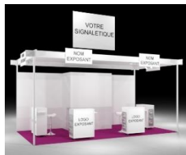
Visuel stand 18 m 2 - 3 faces (Paris)