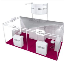
Visuel stand 18 m 2 - 3 faces (Lille, Lyon)

Pour le détail de 4 faces ouvertes, nous consulter.